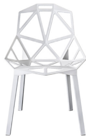
Outdoor use Seat + Legs: White 5110