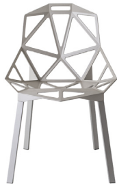
Outdoor use Seat + Legs: Light Grey 5254