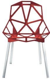
Outdoor use Seat: Red 5085 Legs: Natural, Glossy, Anodised