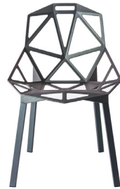
Outdoor use Seat + Legs: Grey Green 5256