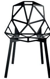
Outdoor use Seat + Legs: Black 5130