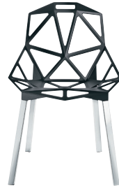
Outdoor use Seat: Grey Anthracite Metallised 5122 Legs: Natural, Glossy, Anodised