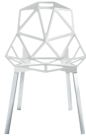
Outdoor use Seat: White 5110 Legs: Natural, Glossy, Anodised