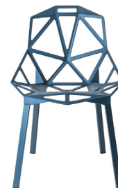
Outdoor use Seat + Legs: Blue 5255